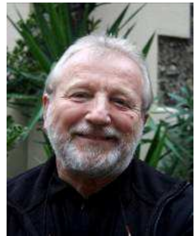
Verba volant, scripta manent